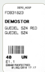
Tarjeta RFID blanca Pedido standard

El sistema Dyane SmartKanban® se basa en el uso de tarjetas RFID ubicadas en las cestas de las estanterías modulares de los almacenes de planta gestionados bajo el principio Kanban. Para ello se emplea un sistema de doble compartimento para indicar la necesidad de reponer los materiales y la urgencia de reponer estos mismos según se ubiquen en el primer compartimento (tarjeta blanca / pedido normal) o segundo compartimento (tarjeta naranja / pedido urgente) respectivamente.