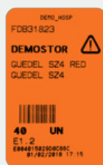
Tarjeta RFID naranja Pedido urgente

La implantación de este proceso de gestión, en los puntos de consumo de las unidades asistenciales, permite al hospital optimizar sus capacidades de almacenaje, aplicar el principio FIFO para erradicar los stocks caducos, y lograr el objetivo de "pedido igual a consumo".