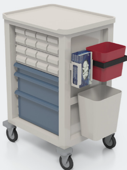
Carro de medicación y unidosis