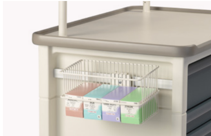
Cesta de suturas