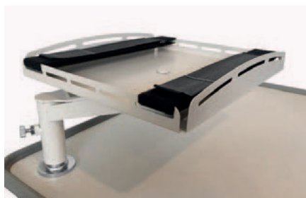
Bandeja para desfibrilador