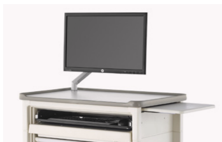
Soporte para ordenador