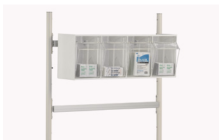
Cassette basculante de 3 a 6 cajetines