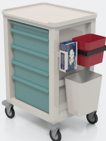
Carro de curas