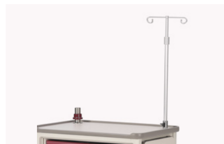
Soporte porta sueros IV