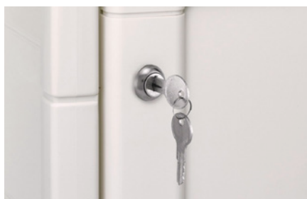
Cerradura de llave