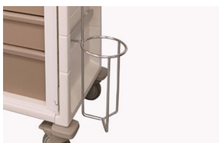
Soporte para botella de oxígeno