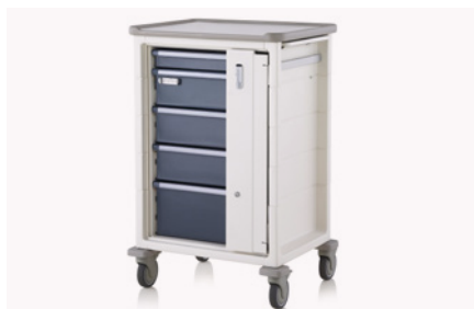
Puerta lateral de bloqueo