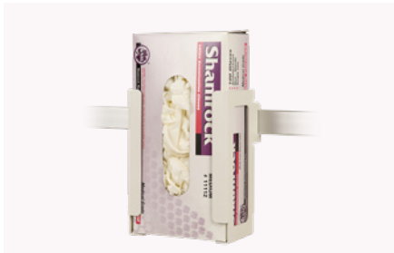
Soporte para caja de guantes