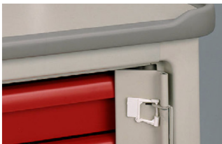
Puertas de seguridad con precinto