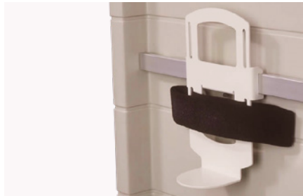
Soporte de velcro para contenedor de agujas