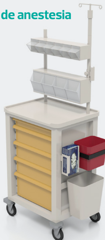
Carro de anestesia