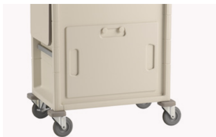
Tabla de reanimación